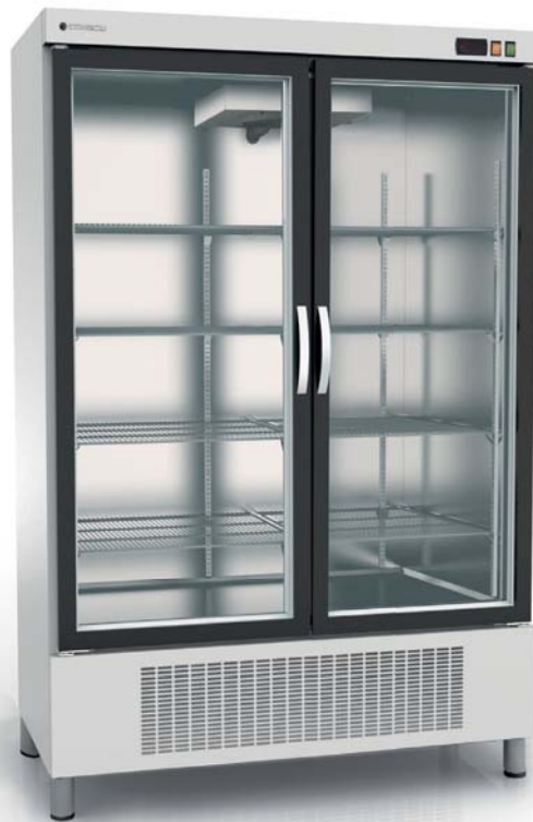
EBR-1302-BI Patas opcionales Optional legs