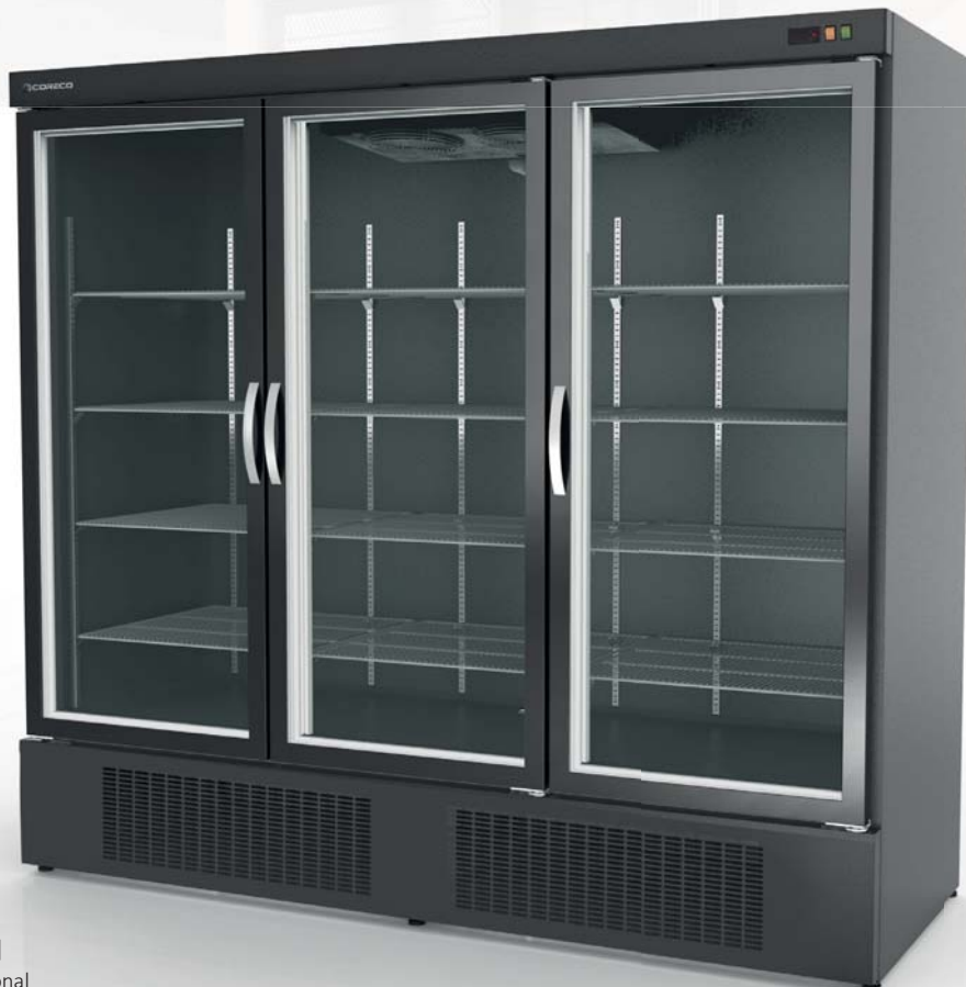
EBR-2003-NN Interior negro, opcional Optional black interior